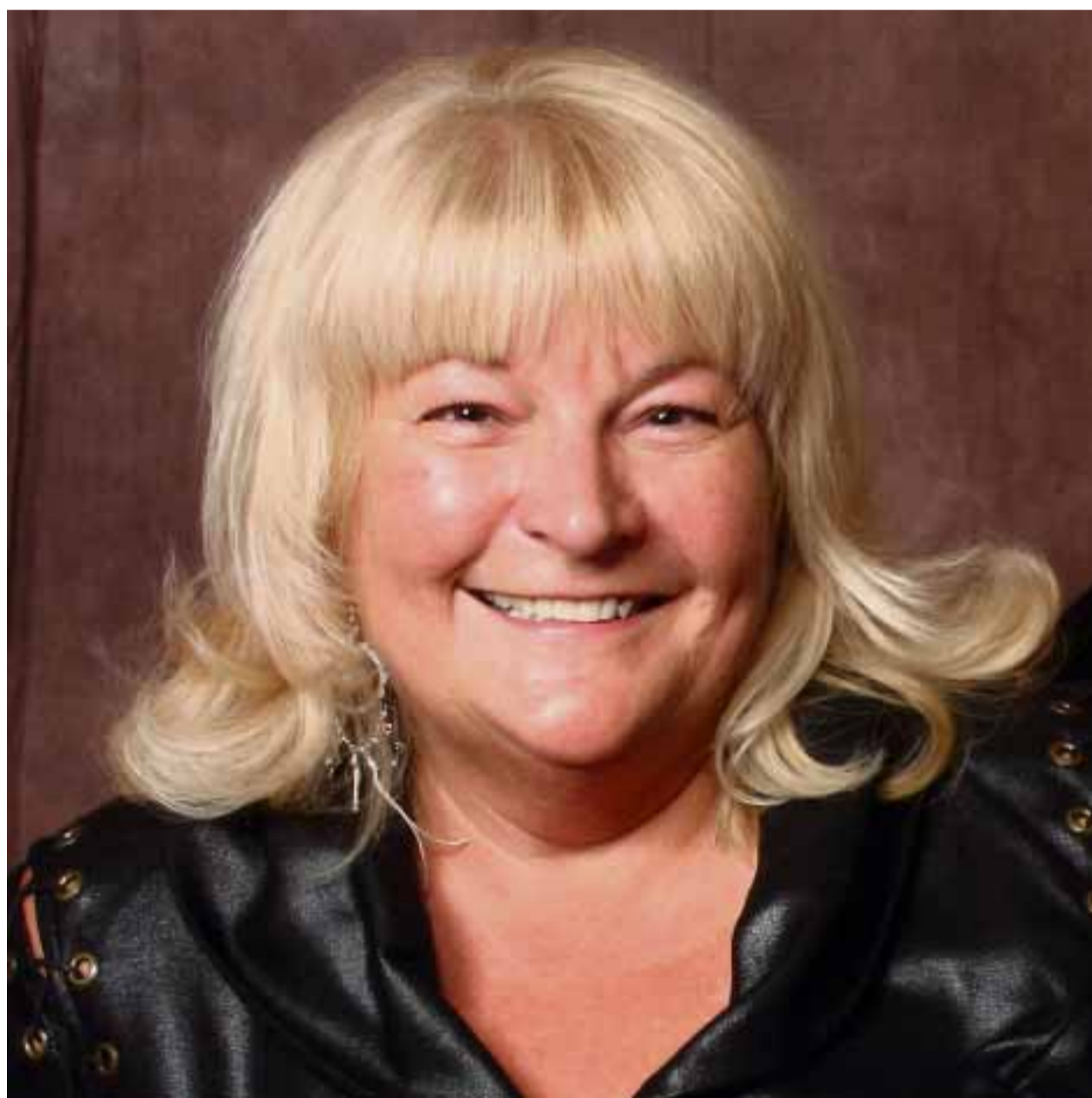
Si la comparaison avec J. K. Rowling ne la gêne pas, Anne Robillard préférerait qu'on la compare à Tolkien.

A.N.G.E. Tome I : Antichristus , d'Anne Robillard. Éditeur : Michel-Lafon. 338 pages.